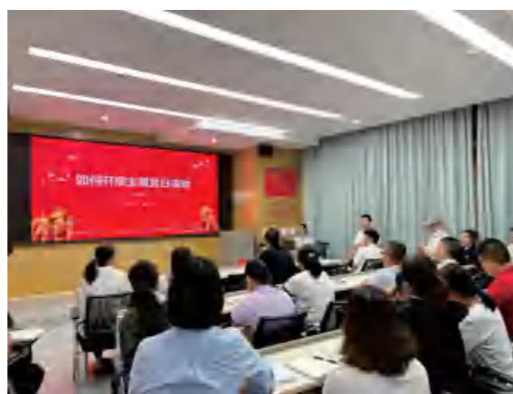
▲ 在卓达大社区举办第五期“党务工作者上讲台”活动

转变“单向灌输”培训方式，打破传统培训框架，创新推出“双向互动+实践输出”的培训模式，推动培训从“输入型”向“输出型”转变。通过引导党务工作者每年到基层党委或所在党支部讲授党课，发挥党务工作者理论宣传作用，推动中央八项规定精神、党的二十届历次全会精神常讲常新、常学常用。依托大社区活动阵地，“流动”举办“党务工作者上讲台”活动5期，21名党务工作者开展专题授课，授课范围立足自身所长，既涵盖党费收支、党内统计等基础党务知识，也涵盖党建引领基层治理打造“完整社区”、“候鸟”党员管理服务、党建品牌谋划等话题，累计培训党务工作者250人次，为党务工作者提供“教学相长”平台，推动全区党务工作水平不断攀升。