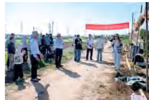
▲ 沈其荣院士团队木霉生物有机肥田间现场会

领域博士团队，聚焦村里的支柱产业黑山羊养殖精准发力。针对黑山羊养殖多年来存在的繁殖效率低、品种退化、饲料成本高等问题，团队从饲草营养、饲喂模式、设施升级、技术推广全链条进行改造，让黑山羊养殖告别“粗放散养”。通过推广自配料和青贮饲草、建设标准化饲料加工车间，北岭村黑山羊养殖成本降低10%以上，存栏量稳定在700只以上，生产性能和养殖效率也同步提升10%以上。不仅如此，村里还成功向外输出黑山羊良种和养殖技术，为其他资源紧缺型村庄提供了一份科技兴牧、壮大集体经济的“北岭样本”。