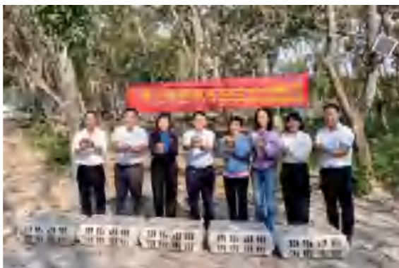
▲ 钱前院士牵线爱心企业捐赠鸡苗助力乡村发展

崖州区创新推出“院士村长”项目，柔性引进一批中国科学院、中国工程院院士，以长期化结对模式，将院士团队的科研阵地搬到田间地头，为崖州区金鸡社区白超队、城西村、抱古村等村（社区）导入更多的产业、人才等资源，助力乡村全面振兴，推动崖州经济社会高质量发展。其中，中国科学院院士钱前和中国工程院院士沈其荣带头参与，分别主攻水稻育种、土壤改良两大核心领域，成了当地科技兴农的“领头雁”。