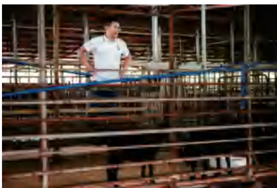
▲ 北岭村博士村长现场指导黑山羊养殖

截至目前，崖州区已聘任5名院士担任“院士村长”，240余位专家人才加入“博士村长”项目，组建28个“博士村长”工作队，服务全区25个村（社区），推动23个科技项目落地实施。这群扎根热