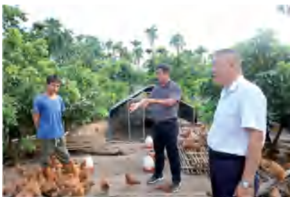
▲ 赤草村博士村长现场指导文昌鸡养殖

乡村振兴，关键在人；田野振兴，核心在智。崖州区有关负责人表示，将持续完善人才机制，优化人才生态，吸引更多优秀人才扎根乡村，推动热带特色高效农业提质升级，为乡村振兴和海南自贸港建