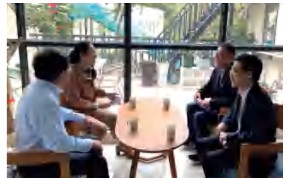
▲ 三亚市委人才发展局有关负责人走访倾听人才心声