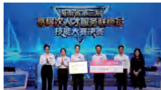
▲海南省第三届高层次人才服务联络员技能大赛颁奖现场

2025年，三亚率先举办市级高层次人才服务联络员技能大赛，70余名联络员同台竞技，全面检验政策理解、实务操作、应急处置等综合能力；同步编印涵盖123个现行人才政策的汇编手册，为队伍提供系统的政策指引。在同年举办的海南省第三届高层次人才服务联络员技能大赛中，三亚市代表队勇夺团体一等奖，崖州湾科技城代表队斩获团体二等奖，2名联络员获个人三等奖，实现全省大赛团体一等奖蝉联，充分彰显三亚人才服务队伍的过硬实力。