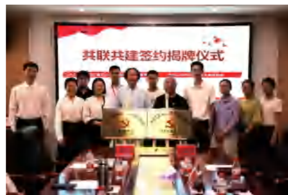
▲ 亚大社区和三亚市心理学会开展共联共建签约

持续深化“抓两头、促中间、强基础”，以结对帮带为纽带，构建“老带新、强带弱”的成长机制，发挥大社区桥梁作用，组织党组织签订结对共建协议书，实现党务工作者之间“一对一”结对帮扶，推动党务工作者从“个体摸索”走向“结对共进”。各党务工作者积极参与“一支部一品牌”创建行动，发挥党组织结对共建合力，立足各党组织服务特色，